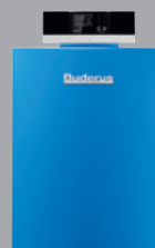
Logano plus GB212