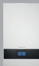
Logamax plus GB172i.2