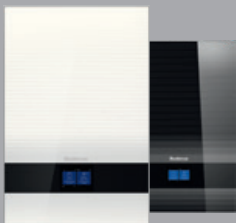
Logamax plus GB192i.2