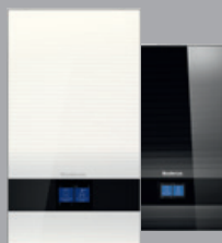
Logamax plus GB182i.2