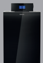
Logano plus KB192i / KB195i